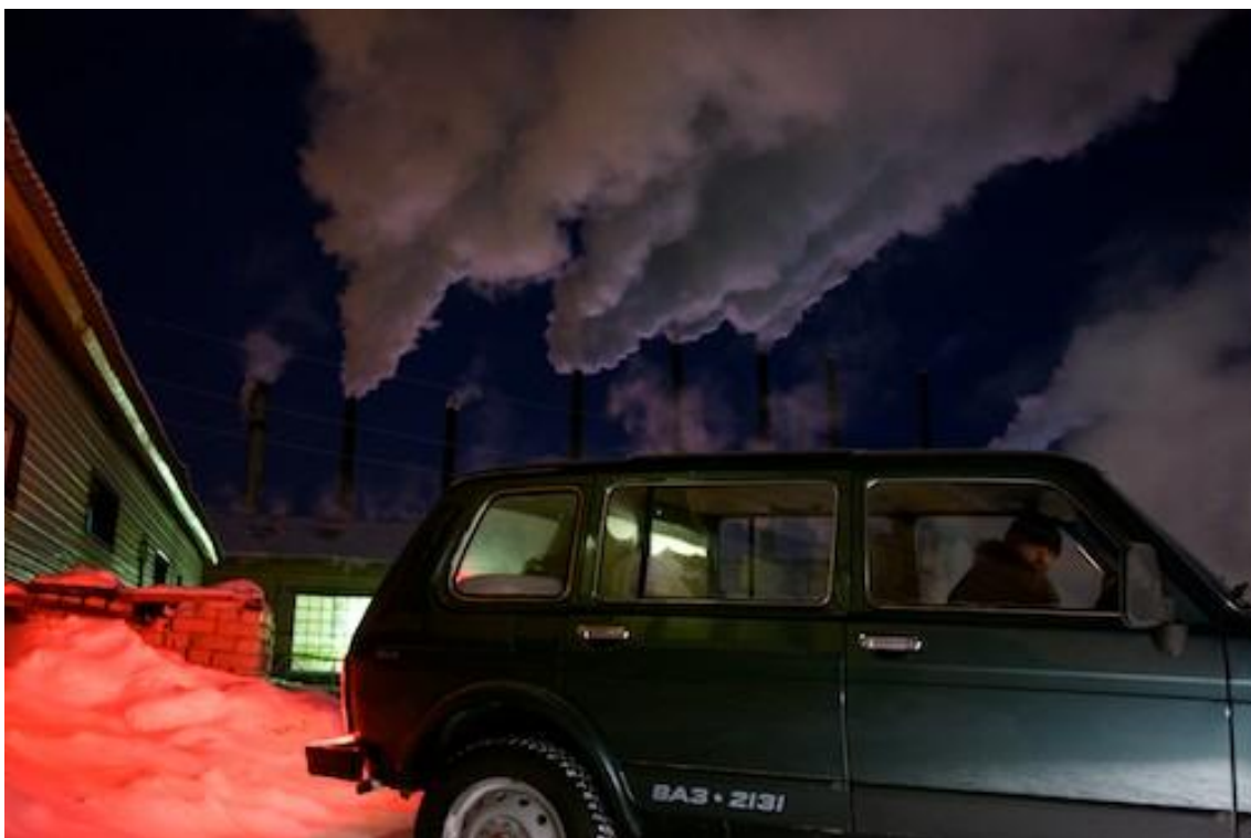
Usine de chauffage urbain rejetant de la vapeur à Narian-Mar (les dépenses publiques pour une ville arctique sont extrêmement élevées).