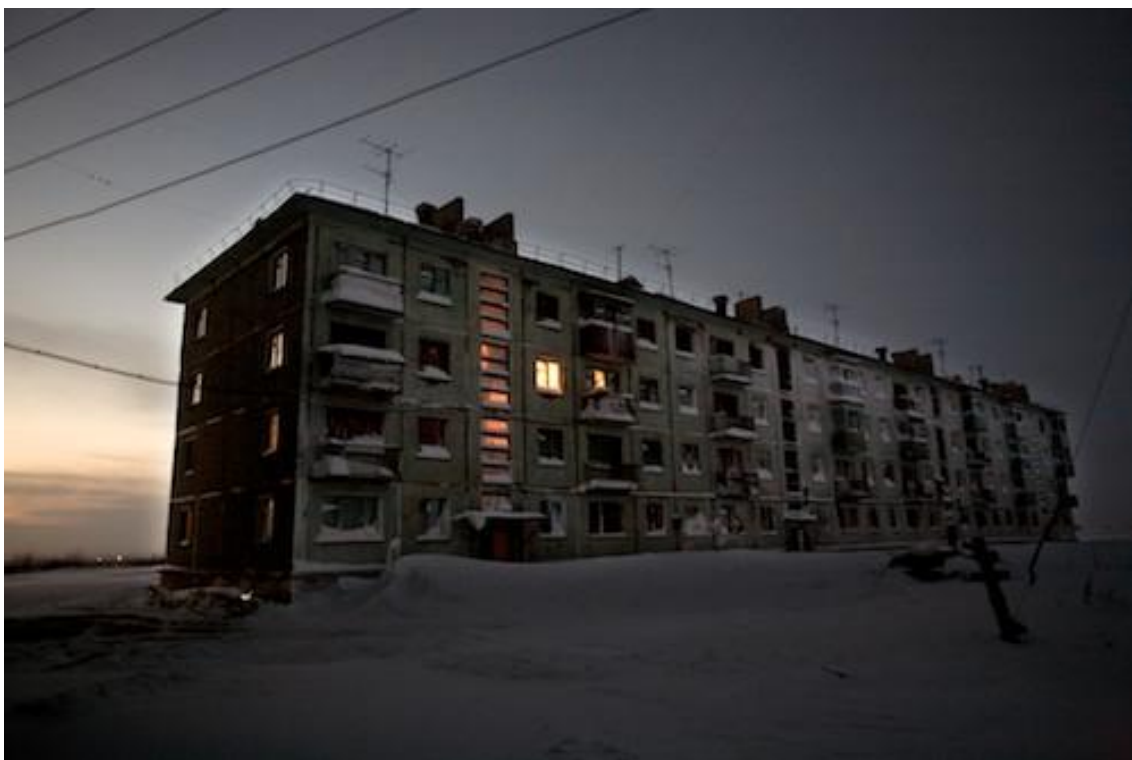
Les habitants ayant fui vers le sud, les bâtiments autour de Vorkuta sont repris par les éléments. Ici, dans le village de Yor Shor, au bord de la toundra, seule une famille est restée.