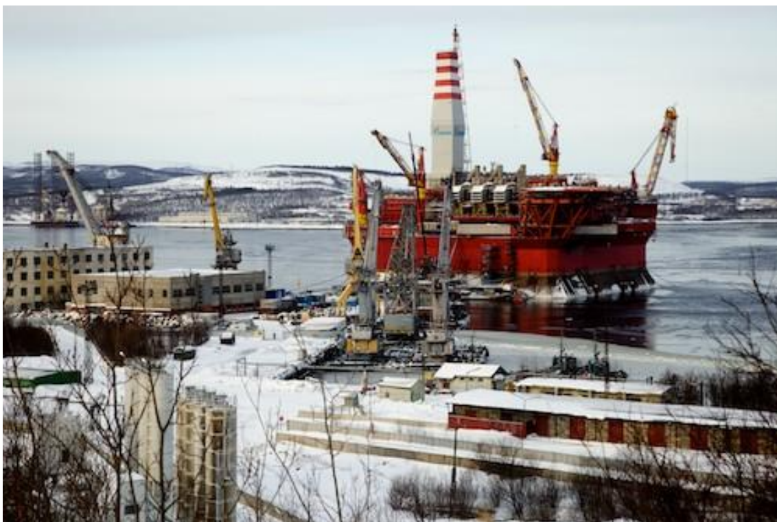
Plateforme pétrolière (résistant à la glace) en cours d'équipement par Gazprom sur la côte de Mourmansk, avant remorquage jusqu'au champ pétrolier de Prirazlomnoye, dans la partie est de la mer de Pechora (60 km environ au nord du district autonome de Nénétsie).