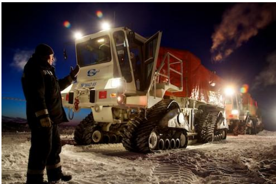
Véhicule tous-terrains de reconnaissance sismique dans la toundra arctique, près de Narian-Mar.