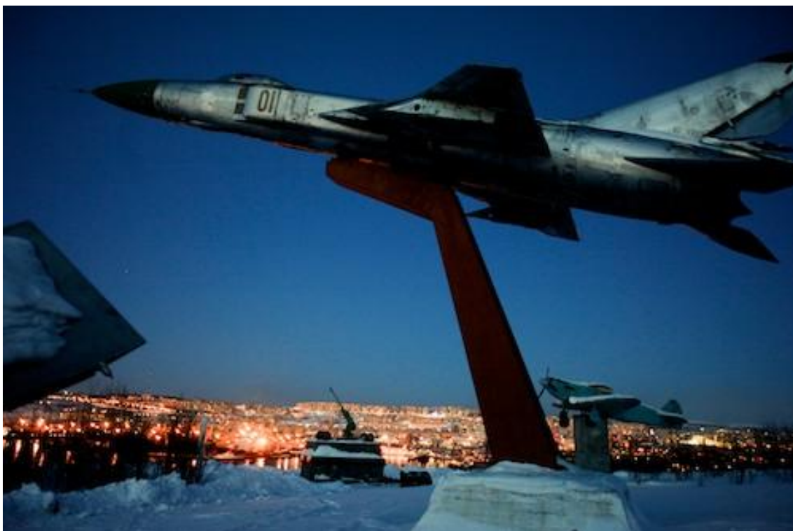
Un monument aux chasseurs surplombant Mourmansk.