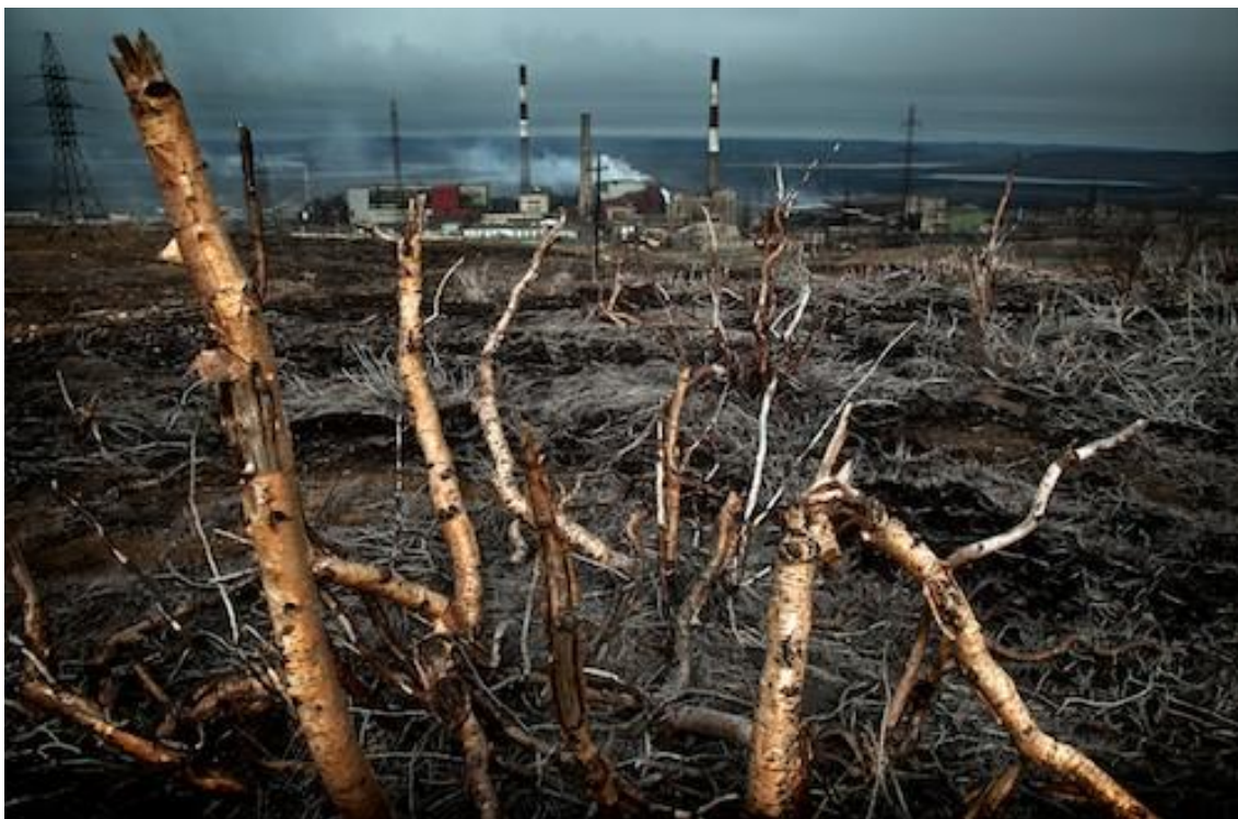
Le combinat minier de Nikel